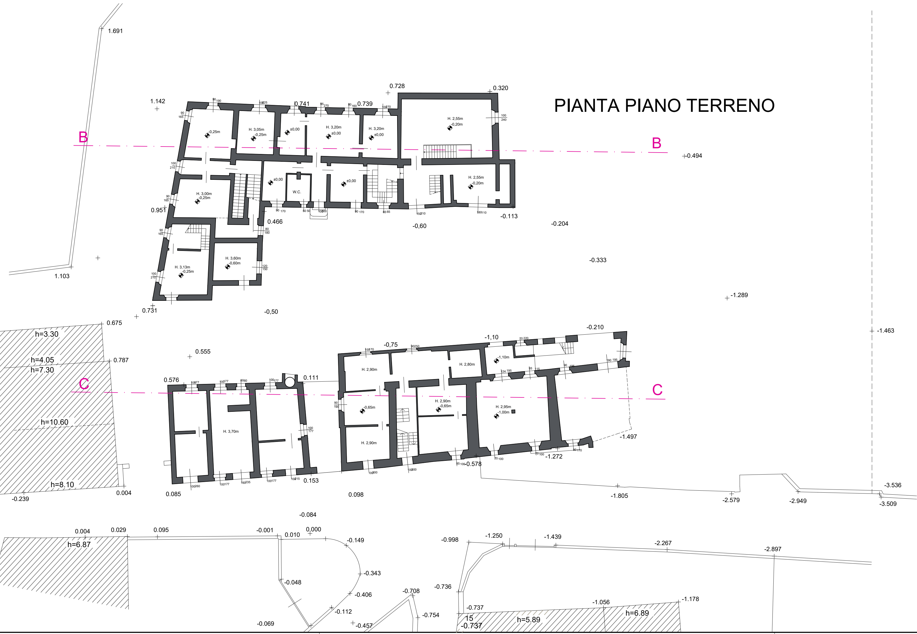
PIANTA PIANO TERRENO